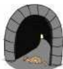
LES FOUINEURS BEDOUINS