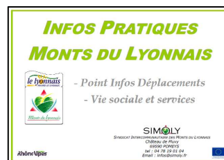
Classeur Infos pratiques des Monts du Lyonnais